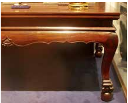
附圖清 黄花梨獸爪攬球足高束腰長方幾（故宮博物院藏）