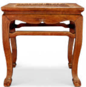
附圖 明 黄花梨三彎腿大方凳（中 買聖佳2015秋季藝術品拍賣會）