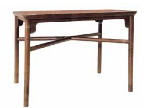
附圖 明項元汴款黄花梨十字根小畫桌（無錫私人藏）