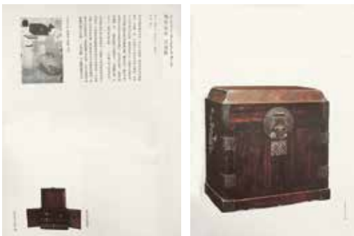
附圖《留餘齋藏明清家具》著錄